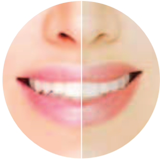
Υψηλός CRI Χαμηλότερος CRI

Παράγοντας δείκτη χρωματικής απόδοσης (CRI) 90 στα 5.000 K, η λυχνία LED της A-dec μιμείται τη φύση. Παρατηρήστε τη διαφορά κατά τη σύγκριση με οδοντιατρικούς προβολείς LED κατώτερης ποιότητας και χαμηλότερου CRI.