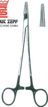
Βελονοκάτοχο 41.256.16 (16,0 cm)