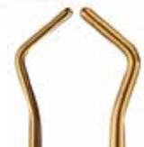
NB MINI PLUGGER N-5124P

Τα εργαλεία αυτά έχουν σχεδιαστεί από τον Dr. Nasser Barghi και είναι κατασκευασμένα από νιτρίλιο τιτάνιο, ώστε να έχουν χαμηλό βάρος και αντικολλητικές ιδιότητες. Διαθέτουν εργονομική λαβή. ΤΙΜΗ: 35 €