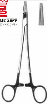
Βελονοκάτοχο 41.256.16 (16,0 cm)